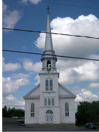
Église de Saint-Gabriel-de-Rimouski

L'église de Saint-Gabriel-de-Rimouski est un édifice de culte construit en 1903. Son architecture est d'inspiration Néo-Renaissance. Ses concepteurs sont David Ouellet, architecte et Thimothé Landry, entrepreneur. Le revêtement extérieur des murs est en crépi. L'intérieur est formé d'une nef à trois vaisseaux avec un plafond en arc. Le bois est le matériau dominant de la structure et de la décoration. L'orgue est de marque Casavant. Cette église est catégorisée moyenne (D) dans l'inventaire des lieux de culte du Québec.