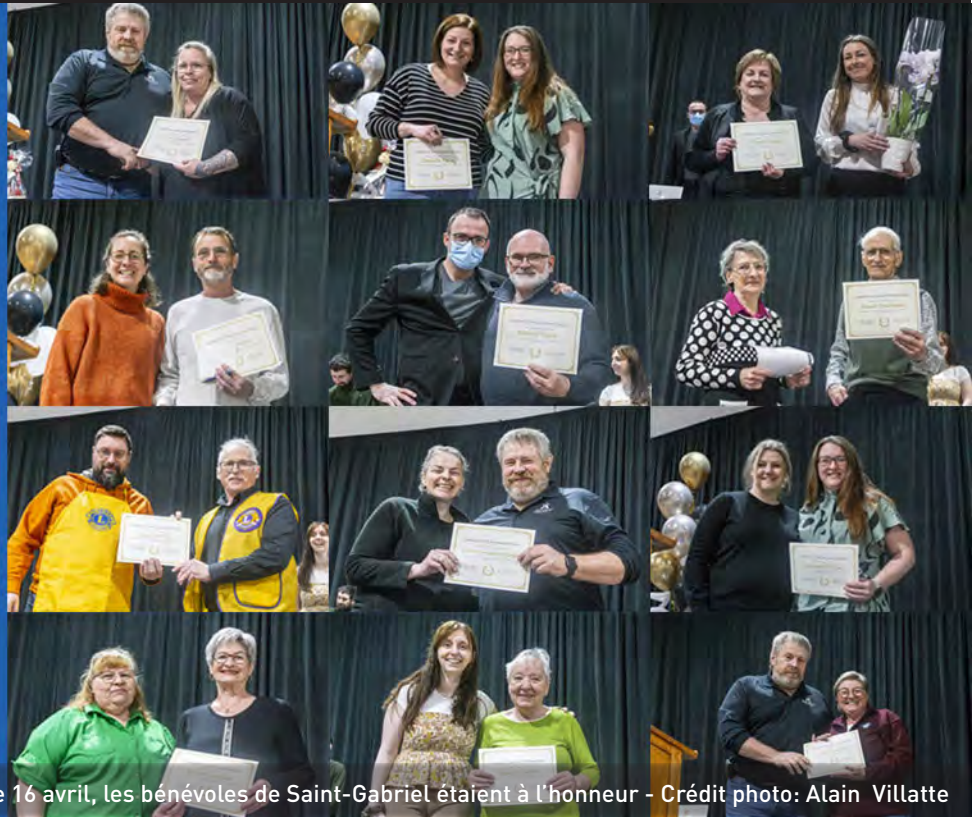
Le 16 avril, les bénévoles de Saint-Gabriel étaient à l'honneur