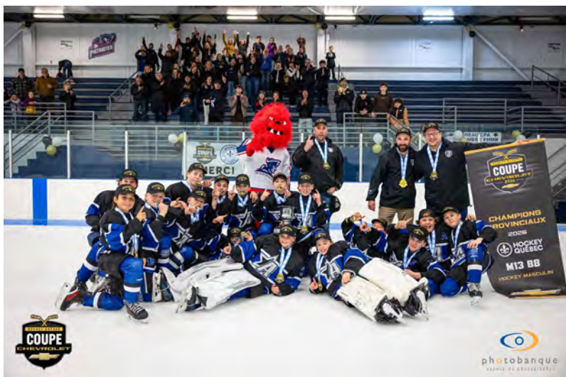
Équipe M13 BB des Ambassadeurs-Express Champion 2026 de la coupe Chevrolet

Cette victoire est une source de fierté pour toute la municipalité de Saint-Gabriel et témoigne du dynamisme et du potentiel de notre relève sportive. Bravo aux champions provinciaux M13 BB!